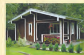
Реклама ИНН 665813768240

*СКИДКИ многодетным семьям, пенсионерам и участникам СВО!