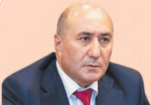
Армен КАРАПЕТЯН заместитель председателя Законодательного Собрания Свердловской области