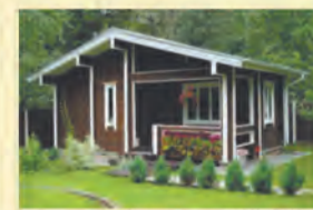
Реклама ИНН 665813768240

*скидки многодетным семьям, пенсионерам и участникам СВО!