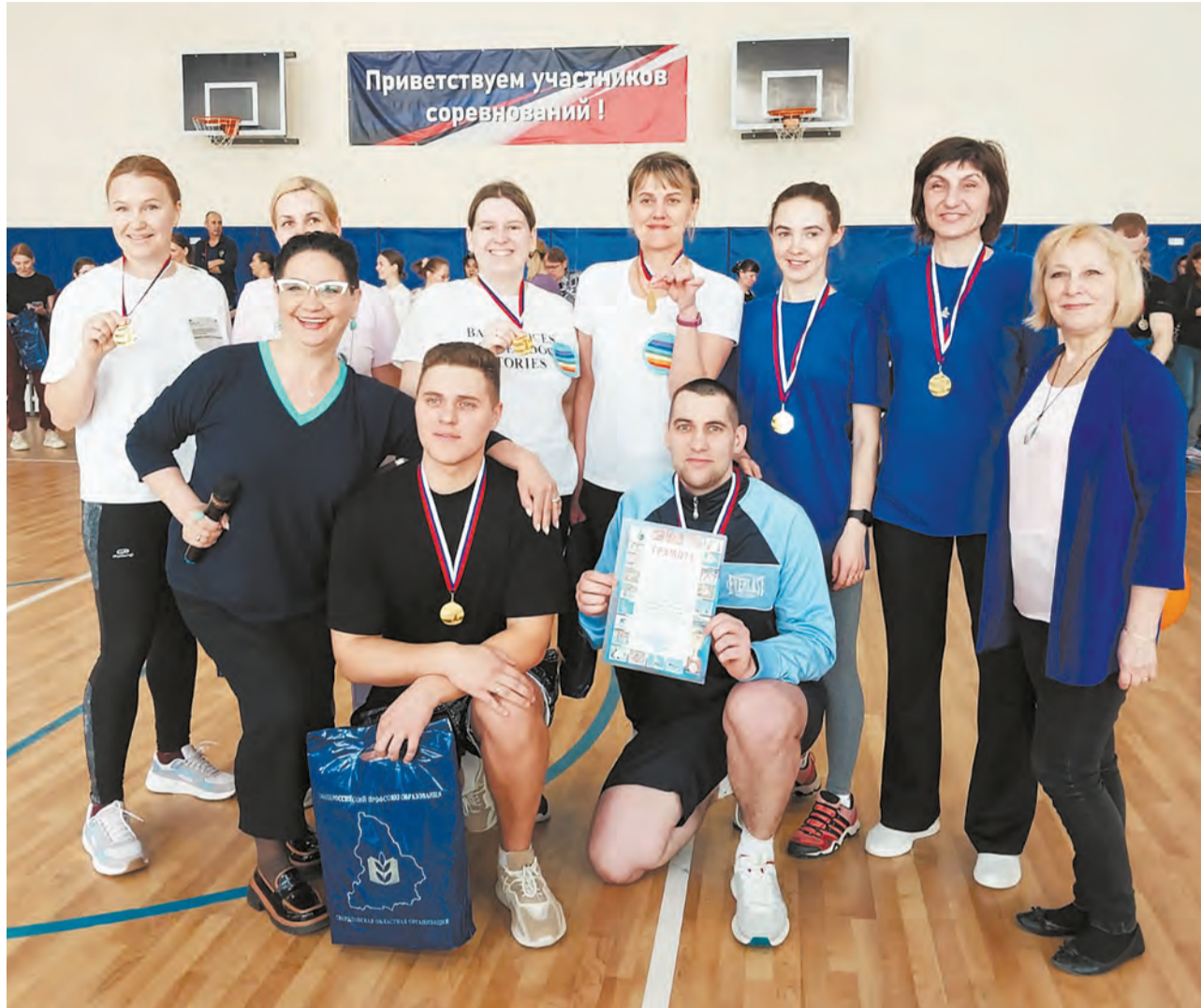
Турпоходы и спортивные турниры помогают лучше узнать коллег

В трудных ситуациях работодатели также обращаются к нам по юридическим вопросам, потому что в обкоме профсоюза (нашей вышестоящей организации) есть пять юристов. В трудных случаях мы обращаемся к ним сами, что-то делаем на месте, в том числе при помощи внештатного