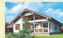
Реклама ИНН 665813768240

*СКИДКИ многочленным семьям, пенсионерам и участникам СВО!