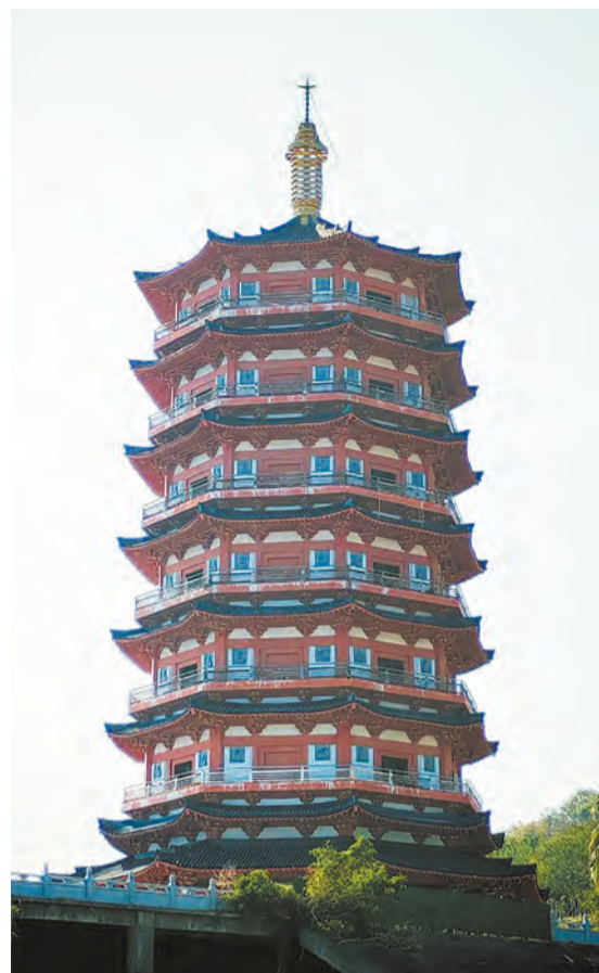
Китайская пагода — многоярусное религиозное сооружение