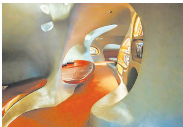
Библиотека при Хайнаньском международном колледже. Внутри