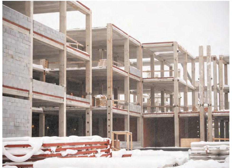
В новом корпусе СОШ № 16 в п. Красный оборудуют современные лаборантские