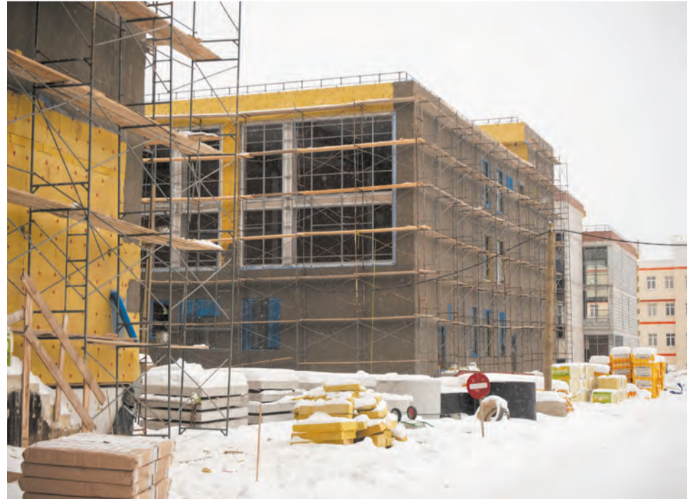
На четырех этажах реконструируемой СОШ № 22 расположатся 49 учебных классов

которые находятся в высокой степени готовности, как здание школы № 22 и терапевтический корпус больницы. Некоторые объекты — филиал школы № 1 и школа в Красном — требуют более пристального внимания со стороны подрядчика, по этим проектам необходимо усиление в части организационных, технических и финансовых решений. Их мы обсуждаем вместе с представителями муниципалитета, чтобы не допу-