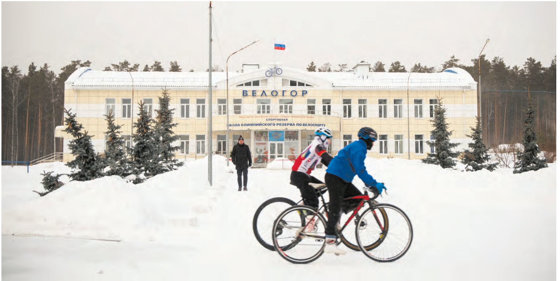
В спортшколе олимпийского резерва «Велогор» будет крытый велотрек

Как продвигаются главные стройки Верхней Пышмы