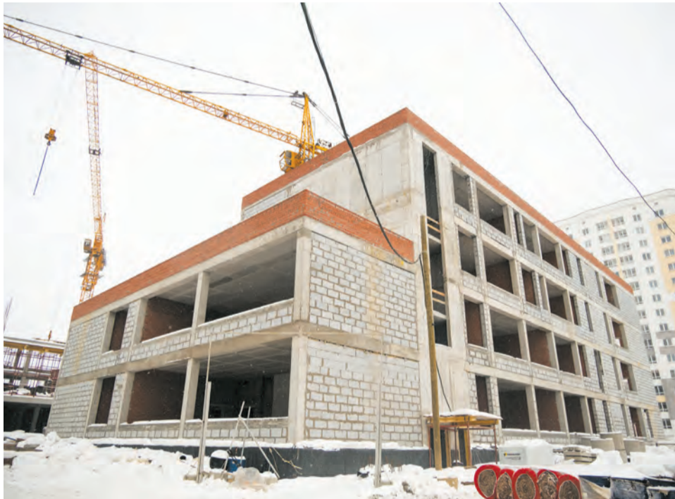
Готовность филиала школы № 1 составляет 27 процентов