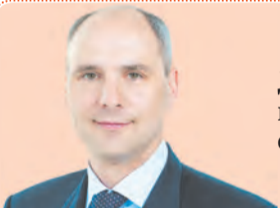
Денис ПАСЛЕР, губернатор Свердловской области

Примите искренние поздравления с праздником мужества, воинской доблести, чести и верности — Днем защитника Отечества! В этот знаменательный день выражаю признательность и уважение всем защитникам России — ветеранам всех войн и участникам боевых действий Специальной военной операции. Дорогие наши защитники, проявленные вами мужество, отвага и героизм — высокий пример патриотизма и безграничной любви к нашей Родине. Отдельно благодарю за тепло и поддержку семьи наших бойцов, волонтеров и неравнодушных жителей городского округа, которые ежедневно плетут маскировочные сети, шьют и вяжут, готовят и собирают посылки для ребят-защитников. Низкий поклон всем, кто сражался и сражается за мир! Помним и чтим каждого, кто погиб, отстаивая рубежи нашей Родины! Пусть молодое поколение учится на примере отцов и дедов мужеству, храбрости, беззаветной любви к Отчизне. Воспитание наших детей в духе патриотизма, знание истории нашей страны, уважение традиций русского воинства являются залогом мирного развития России в будущем. Дорогие наши защитники, от всей души желаю вам стойкости и мужества, успехов на боевом посту! Помните, что именно вы создаете непреодолимую мощь Российской армии. Желаю вам здоровья, силы духа, веры в победу, надежного тыла и поддержки ваших родных и близких. Пусть ваша жизнь будет наполнена радостными событиями, а сердца согреты вниманием и заботой любящих вас людей!