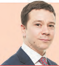
Иван ЗЕРНОВ, глава городского округа Верхняя Пышма